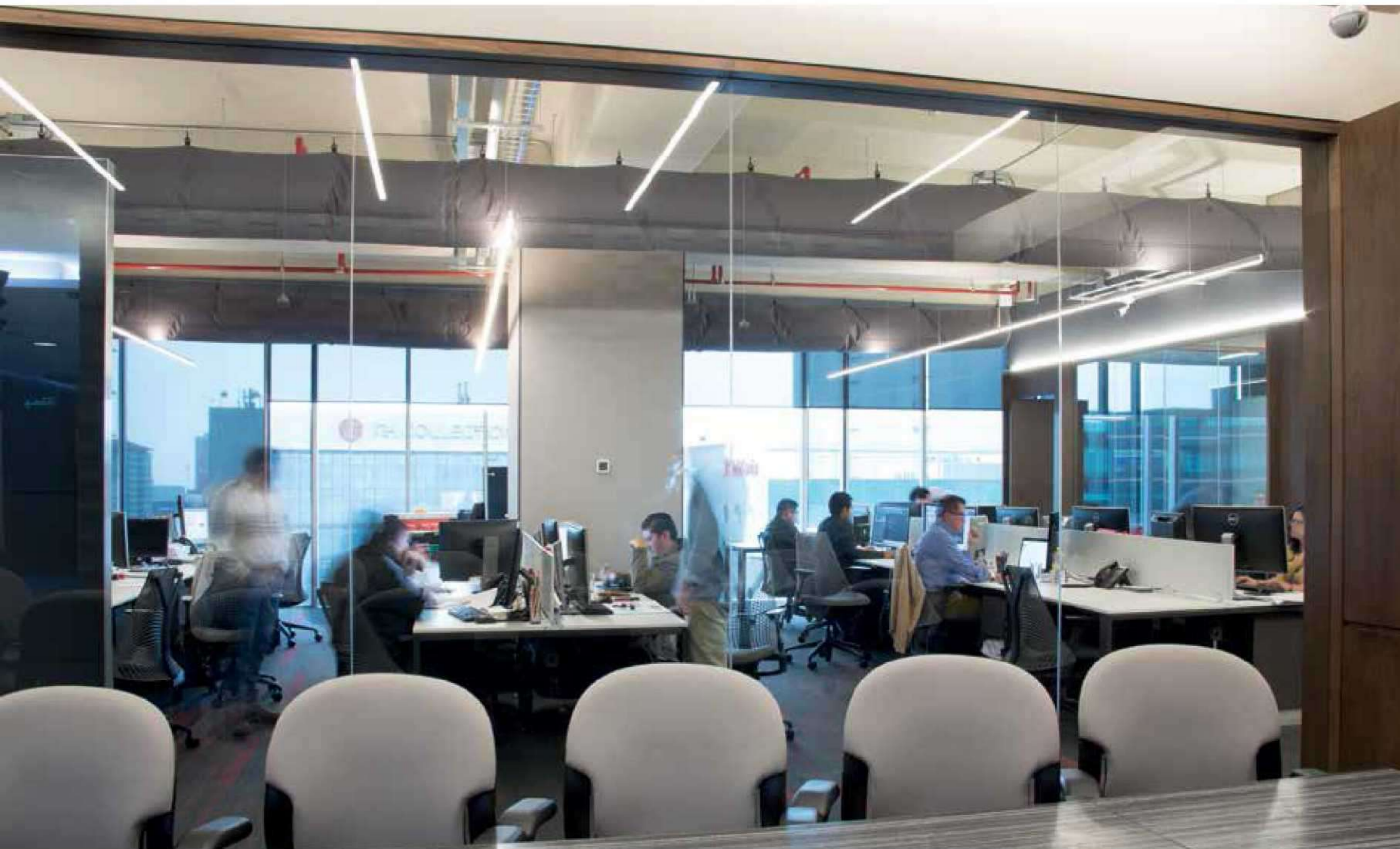
Nombre del proyecto: Oficinas Grow Arquitectos. Año: 2018. Proyecto arquitectónico: Grow Arquitectos / Arq. Gonzalo Cantero / Arq. Bernardo Cantero / Arq. Fernando Cárdenas / Arq. Gerardo Velasco. Ubicación: Santa Fe, Ciudad de México. Construido (m 2 ): 350