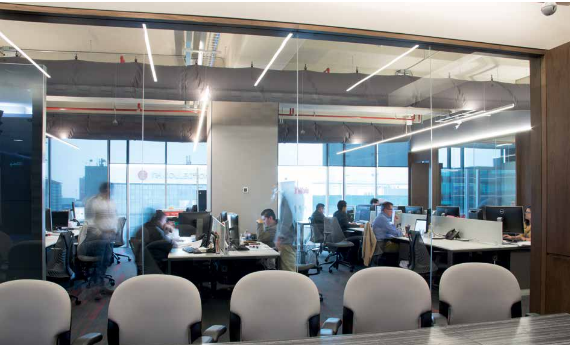
Nombre del proyecto: Oficinas Grow Arquitectos. Año: 2018. Proyecto arquitectónico: Grow Arquitectos / Arq. Gonzalo Cantero / Arq. Bernardo Cantero / Arq. Fernando Cárdenas / Arq. Gerardo Velasco. Ubicación: Santa Fe, Ciudad de México. Construido (m 2 ): 350